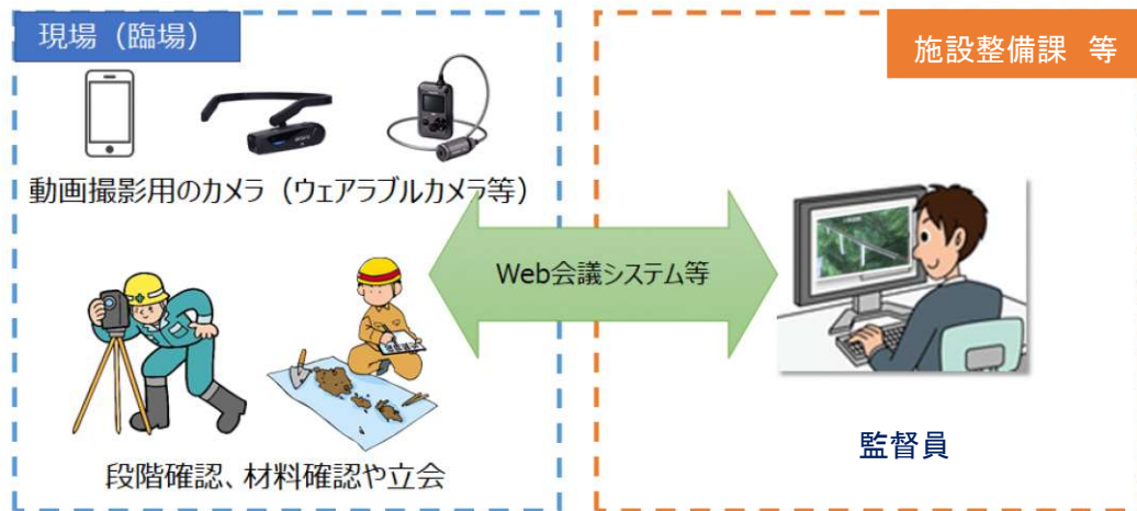
図 3 - 1 機器構成 (例)

なお、Web 会議システム等については、公共工事、公共発注機関等で活用実績があるなど、十分な情報セキュリティが確保されたものとする。