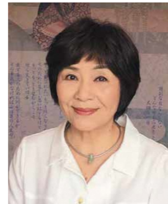
里中 満智子氏 マンガ家 Machiko Satonaka, Manga Artist

「トキワ荘」の再現は、単なる建物の復元ではありません。かつてトキワ荘に集まった若い才能が、お互いに刺激し合い、支え合って、ここから生み出した「日本のマンガの発展の原点」に思いを馳せる場所なのです。昭和20～30年代、まだマンガが社会的に認められなかった時代に、新しい表現に取り組んだ人々の息遣いを感じられる、心のタイムカプセルなのです。再現された「トキワ荘」が、ここを訪れる人々の心を豊かに満たしてくれる場になりますように、期待しています。