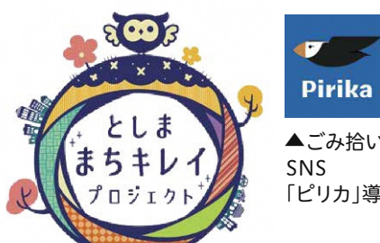
▲としま「まちキレイ」プロジェクトロゴ