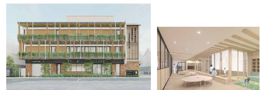
▲児童相談所・長崎健康相談所イメージ