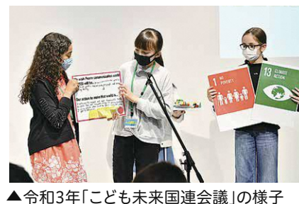
▲令和3年「こども未来国連会議」の様子