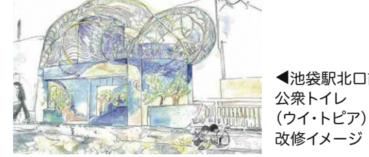
▲池袋駅北口前公共トイレ(ワイ・トピア)改修イメージ