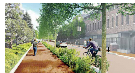
▲整備後の立教通りイメージ

●池袋駅北口前公共トイレの改修事業経費…6,800万円(内：令和3年度予算からの繰越額…3,300万円)