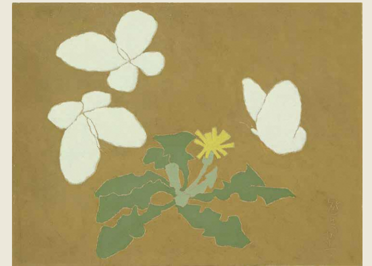
「蝶」1957年頃 油彩/熊谷守一つけち記念館