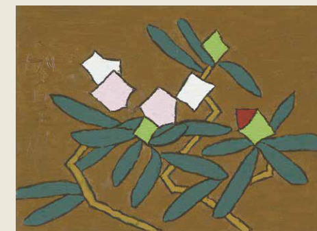
「しゃくなげ」1973年 油彩/熊谷守一つけち記念館