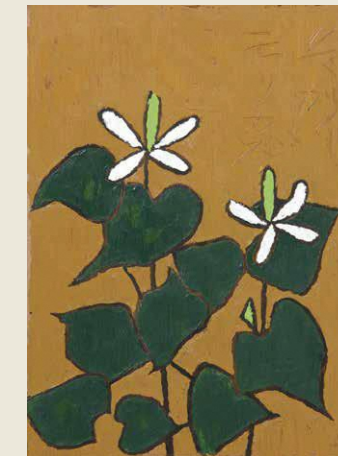
「どくだみ」1973年 油彩/熊谷守一つけち記念館