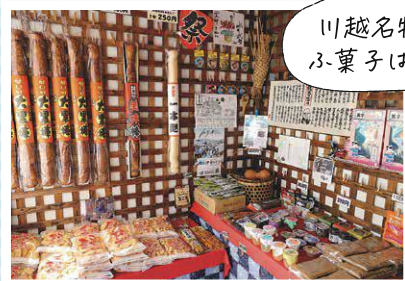
川越名物のジャンボふ菓子は栄伸発祥!

開業25年。昔懐かしの餡菓子や煎餅、菓子販売しているお店。店先に吊るされているバットのような「大黒棒」はインパクト抜群!大英博物館のマンガ展で飾られたものと同じアトム人形にも注目です。