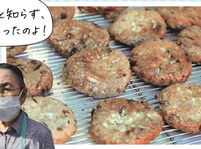
▲がんどきが人気です