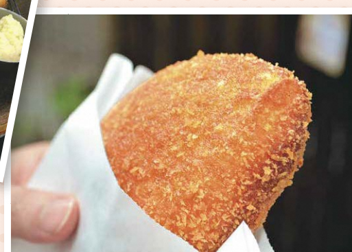
▲南長崎の香辛料メーカー「テオー食品」のカレールーを使用。