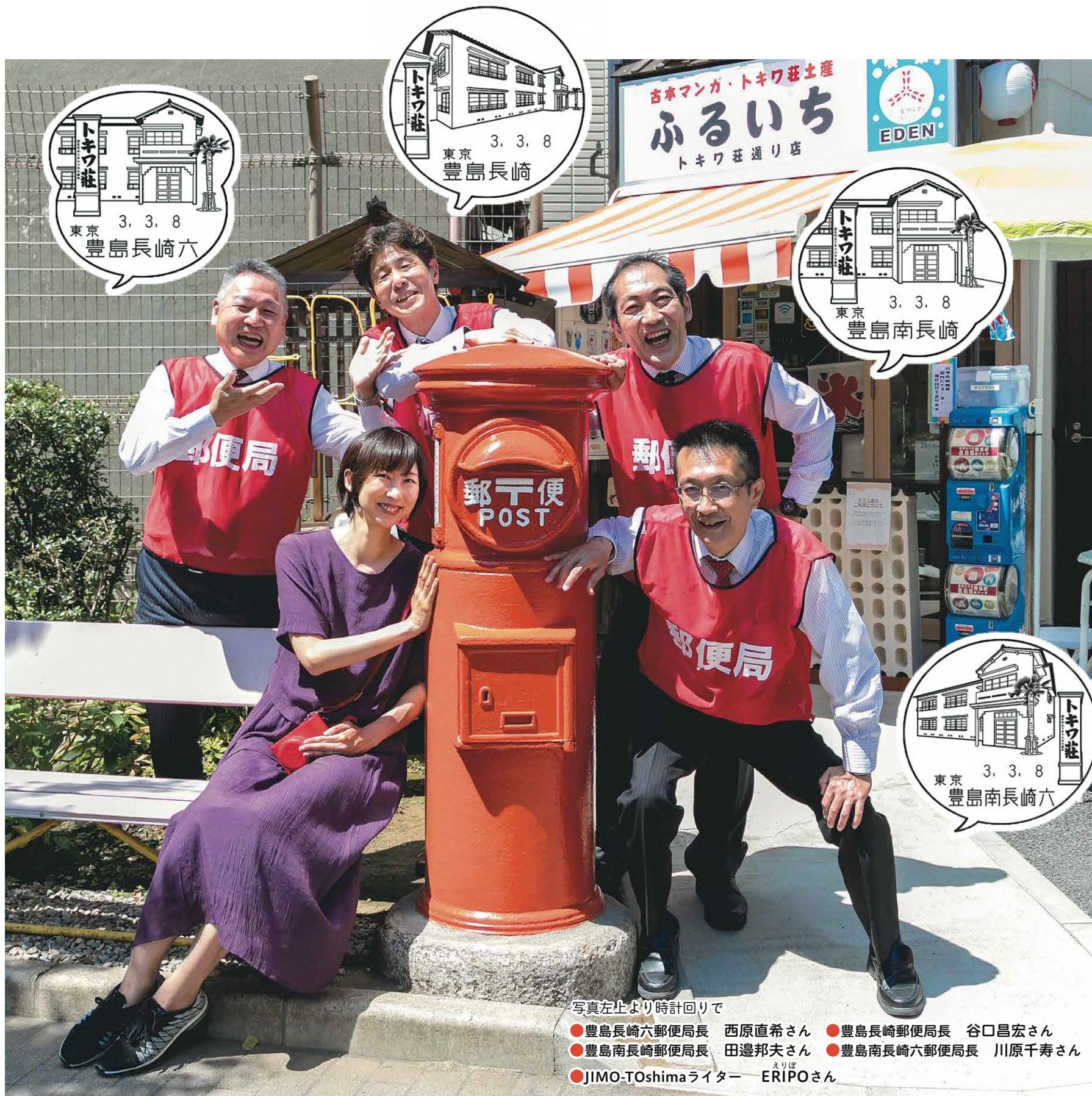
写真左上より時計回りで