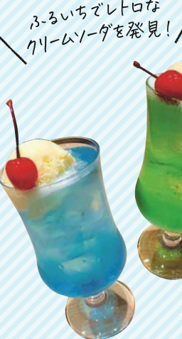
ふるいちでレトロなクリームソーダを発見!