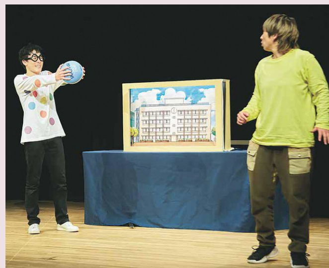
紙おしばい「ことだまの森」舞台写真

紙おしばいは、伝統文化の紙芝居と現代演劇の手法を組み合わせた舞台表現です。今回は、お母さんがケガをしたため人間の街に行くことになった、こだぬき兄弟のお話。初めてのおつかいにハラハラドキドキの連続。力を合わせて困難を乗り越える様子を通じて「守り・守られる関係の大切さ」を描きます。