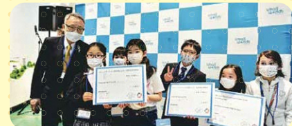
今年3月開催「子ども未来国連会議」の様子

次世代を担う子どもたちがSDGsの視点で、区制90周年から100周年に向けての豊島区の未来図を描く取り組みです。「住み続けたい未来の豊島区」をテーマに、9月2日まで子どもたちからアイデアを募集。9月23日開催の「豊島区子ども未来国連会議」では、自分の考えたアイデアを持ち寄り、グループに分かれてワークショップを行い、発表します。