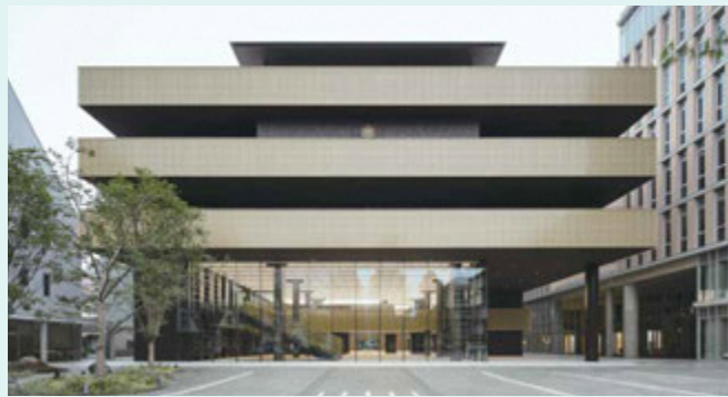
大正大学附属図書館