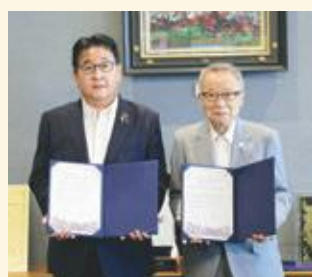
中富良野町長と区長