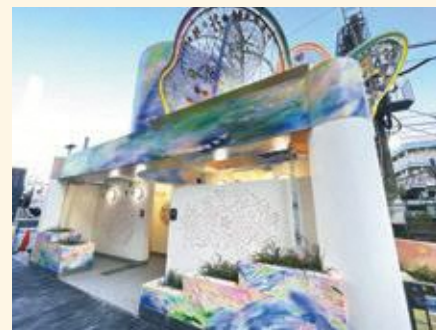
完成したウイトピア