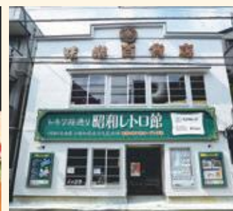
トキワ荘通り昭和レトロ館(豊島区立昭和歴史文化記念館)