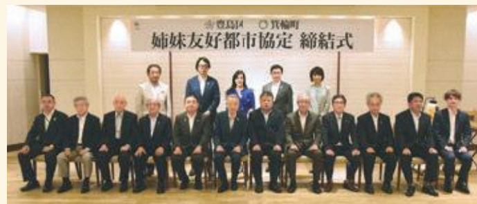
箕輪町との協定締結式にて