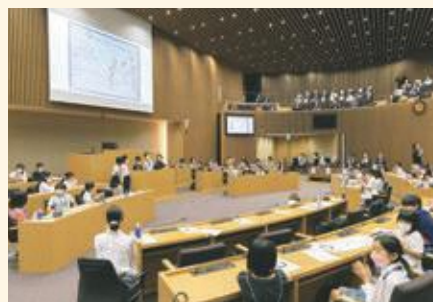
豊島区子ども未来国連会議