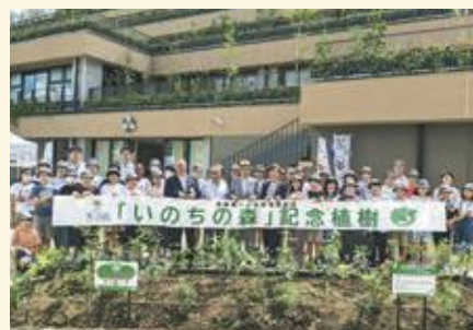
池袋第一小学校で6年生が記念植樹