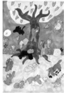
昨年度グランプリ作品

◇募集期間…5月10日(水)まで◇桜を描いたはがきサイズの作品を募集。グランプリ受賞作品は、次年度さくらウィークのプレゼントデザインに起用します。応募作品は5月27日(土)～7月3日(月)まで駒込図書館で展示◇小学生以上④作品を「〒170 - 0003 駒込2 - 2 - 2 駒込図書館」へ郵送か持参。詳細は問い合わせください。 観当館 ☎3940 - 5751