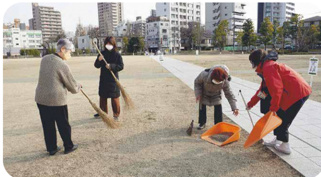
▲竹ぼうきを使って芝生の掃除