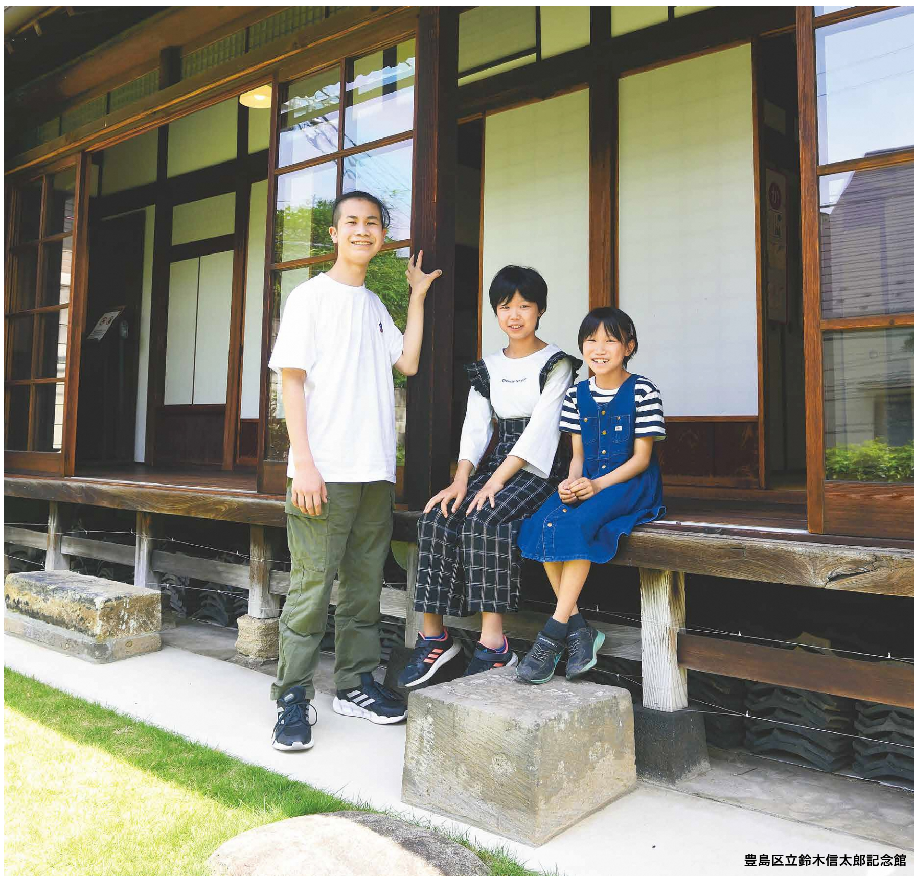
豊島区立鈴木信太郎記念館