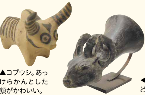
▲コブウシ。あつからかんとした顔がかわいい。

シリア発掘コーナーの展示は当館がシリアで現地発掘し、シリア政府との協定により日本に持ってこられたからこそ。研究機関として、研究でわかった最新情報を伝えています。