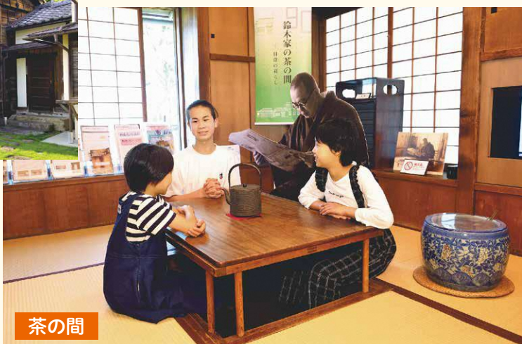
▲終戦後に増築され、家族だんらんや食事の場に(1946年建築)。