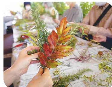
▲葉東(スワッグ)作り