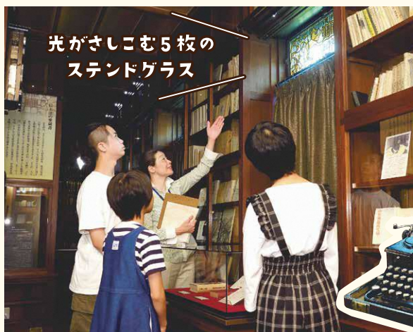
▼愛用していたタイプライター

フランスからの帰国時に、船火事で約1,000冊の本を失ったことをとても悲しみ、二度と同じ思いはしないという決意のもと造られました(1928年建築 鉄筋コンクリート造)。1945年の空襲の炎にも堪えました。最も愛した研究生活の拠点で、尊敬する文豪や友人から贈られた本もたくさん保管されています。友人と集まってワインを飲んだり語り合ったりするサロンでもありました。