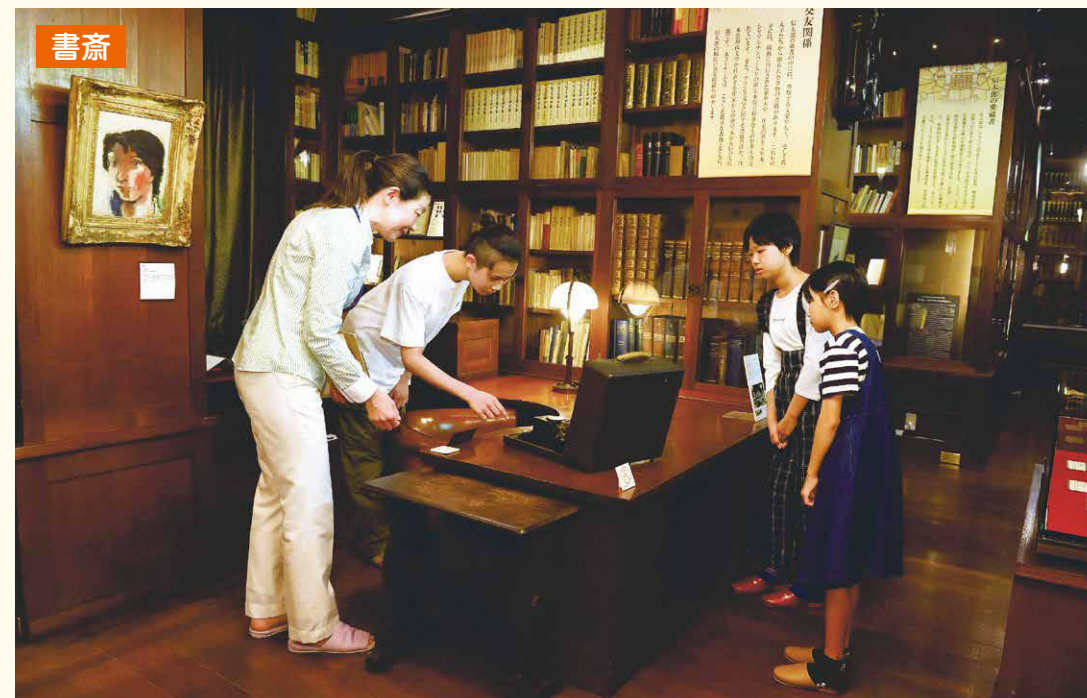
▲机と椅子は信太郎の体格(身長約160cm)に合わせたオーダーメイド

住宅地にたたずむ当館。書齋、茶の間、座敷の3つの棟から成り、鈴木信太郎の研究の業績や旧宅を紹介しています(区指定有形文化財)。学芸員の案内で子どもたちがその魅力に触れてみました。