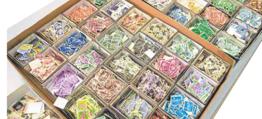
▲おなじみの切手から海外の切手など様々