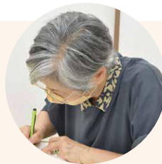
▲決まったことや次回の予定を忘れないように手帳に記入するBさん

私は記憶力テストなどを通して、自分でも危ないと感じていたので、認知症と診断されたときもあまり驚きませんでした。本人ミーティングではたくさんお話ができるので、気持ちも楽になりますし、話を聞いて気づくこともたくさんあります。認知症は進行してから気付くことが多いですが、早期発見できれば自分でも周りの人もその対応ができます。同じ症状の間仲間と交流情報交換ができると、気持ちがとても楽になって、認知症はただ老いていく過程の一つだと考え方も変わってきますよ。とにかく、早期発見が第一。症状があってもなくても、念のため認知症検診を受けてみてくださいね。