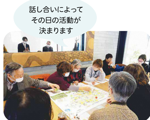
▲としま目指せ100年「長寿村すごろく」いきいきクラブIN豊島作成