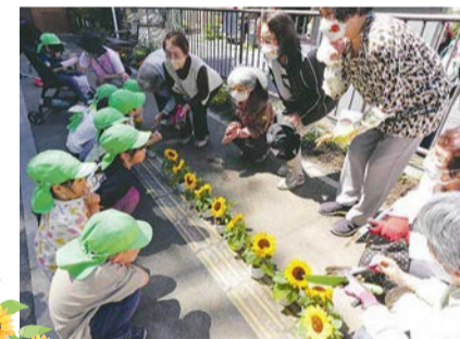
雑司が谷中央児童遊園

公園等みどりの協定は、地域の皆さんで構成されるボランティア団体が、みどりを増やし、育て、守る活動を支援する制度です。お花好きの地域の方々が公園などの緑地や花壇の管理で活躍されています。