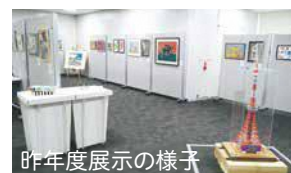
昨年度展示の様子

3月6日(水)〜10日(日) 午前9時30分〜午後4時30分 (最終日は午後2時まで) 区役所本庁舎1階としまセンタースクエア