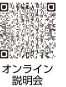
オンライン説明会

3月26日(火) 午後2時～3時30分 としま産業振興プラザ(IKE・Biz)、4月23日(火) 午後1時30分～3時 豊島税務署地下1階会議室◇各40名 申込電話で当署法人課第2部門 ☎03-3984-2171 へ※自動音声の後「2」を選択し、内線322、323へ※説明会の動画も活用してください。