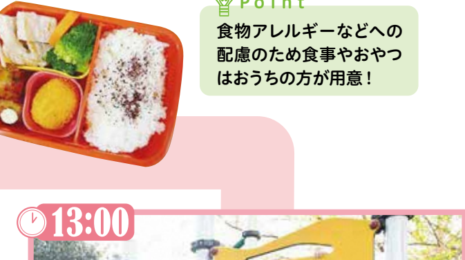
▲持参した手作りのお弁当で昼食。