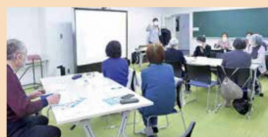
▲参加者同士で交流しながら学ぶ

区民ひろば、東池袋フレイル対策センターなど、様々な場所でスマホ講座を行っています。今回は、地域の担い手のための「スマホ応用講座(全5回)」の様子を紹介します。「SNSとは」から始まり、LINE、Facebookなどの特徴や使い方を学び、各グループ活動の情報発信につなげる講座です。