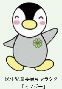
民生児童委員キャラクター「ミンジー」

家庭のことで悩みがあるけど誰に相談したらいいかわからない。そんなときは、皆さんの住む地域にいる民生委員・児童委員・主任児童委員に相談しましょう。民生委員・児童委員・主任児童委員は厚生労働大臣から委嘱され、誰もが地域で安心して暮らせるように、相談や支援を行っています。民生委員は児童委員を兼ね、地域における児童福祉活動の推進者でもあります。現在豊島区では258名(うち15名は主任児童委員)の民生委員・児童委員が活動しています。