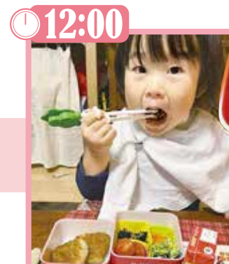
▲持参した手作りのお弁当で昼食。