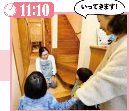
▲お母さんとバイバイして預かり保育スタート!