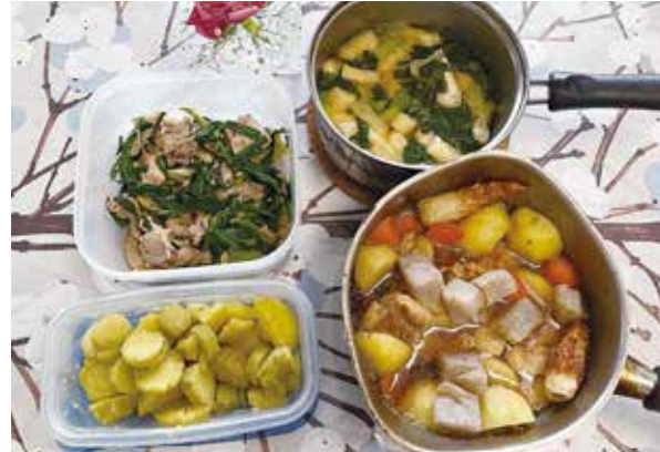
▲冷蔵庫にある食材を活かして4品完成