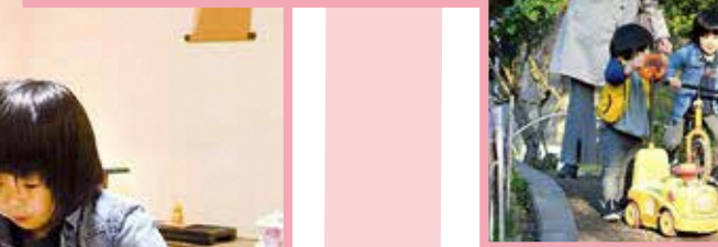
▲天気よくなったので近くの公園でお散歩。