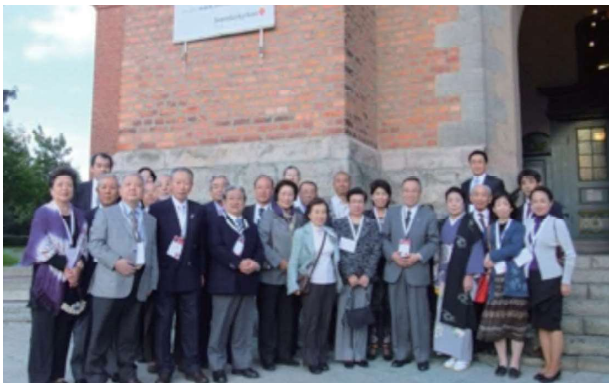
第20回セーフコミュニティ世界会議参加（スウェーデン・ファールン）「地震災害の防止」について発表 区長をはじめ地域住民25人で参加、レイフ・スヴァンストローム氏からレクチャーを受ける 2011.9