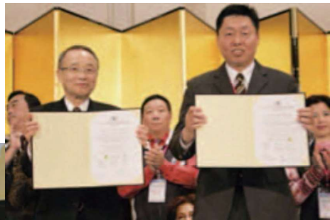
台湾台北市文山（ウェンシャン）区とセーフコミュニティ友好都市協定を締結