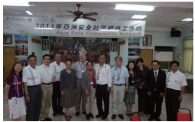
セーフコミュニティプログラム移動セミナー参加（台湾） 台湾セーフコミュニティ認証都市について視察 2011.4