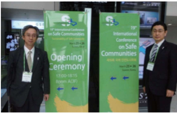
第19回セーフコミュニティ世界会議参加（韓国・水原） 豊島区の取り組みについてポスター発表 2010.3