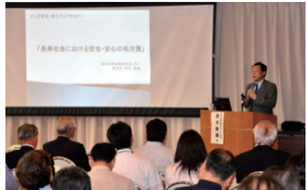
「としま安全・安心フェスタ 2011」開催 2011.6