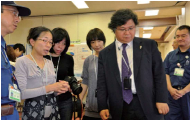
WHO アジア認証センター（韓国）による事前審査 2011.6