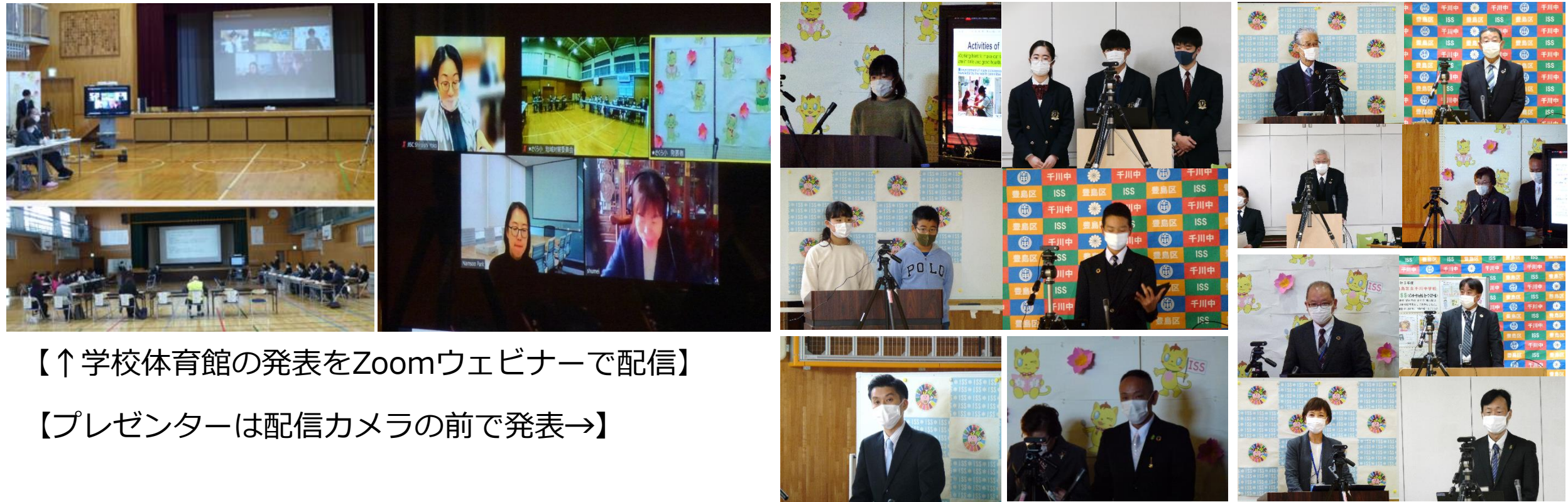
【↑学校体育館の発表をZoomウェビナーで配信】