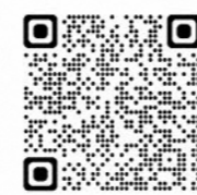
公衆電話マップ QRコード

豊島区内にある公衆電話の場所がわかります。 NTT東日本「公衆電話 設置場所検索」 ( https://publictelephone.ntt-east.co.jp/ptd/map/guidemap/128602390_502991420 )