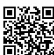
豊島区ホームページ QRコード