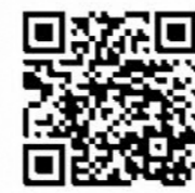
豊島区AEDマップ QRコード

豊島区内にあるAED(自動体外式除細動器)の場所がわかります。 ( https://www.city.toshima.lg.jp/bosai/kajji/index.html )