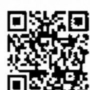
豊島区安全安心メール登録用QRコード