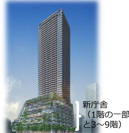
新庁舎 (1階の一部 と3～9階)

〒170-8422 東京都豊島区東池袋1-18-1 豊島区 施設管理部 庁舎建設室 新庁舎機能グループ TEL:03-3981-1186 FAX:03-3981-7054 Eメール: A0011708@city.toshima.lg.jp ※詳しくはホームページをご覧ください。 http://www.city.toshima.lg.jp/kusei/chosha/index.html