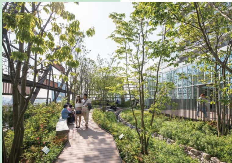
▲屋上庭園「豊島の森」

4階、6階、8階の「グリーンテラス」と外階段でつなぎ、自然環境を体感できる見学・学習ルートを設定しました。