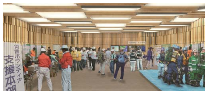
▲災害時の利用イメージ