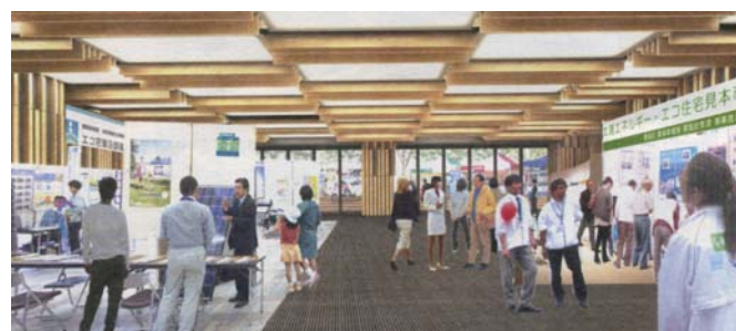
▲企画展開催時のイメージ