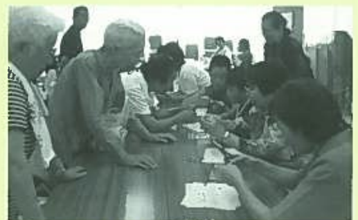
ビーズ細工の様子