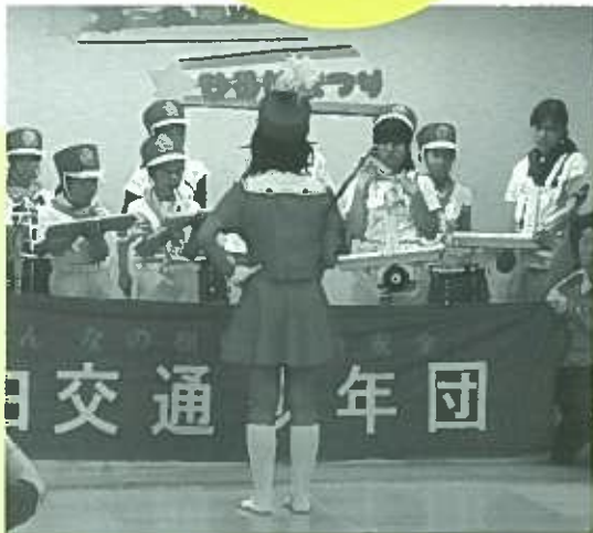
目白交通少年団鼓笛隊の演奏

運営協議会では、今後も長崎に相応しい、みんなが参加でき、集える「ひろば」を目指して様々な活動に取り組んでいきます。