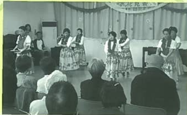
2010年4月17日 「運営協議会設立記念(お花見会)」