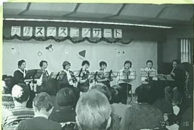
2009年12月18日「クリスマスコンサート」