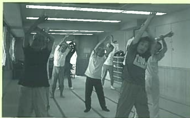
「アメイジンググレイス」の曲にあわせてのストレッチ

第二、第四水曜日 午前10時～11時30分 会費(月額):1,000～1,500円