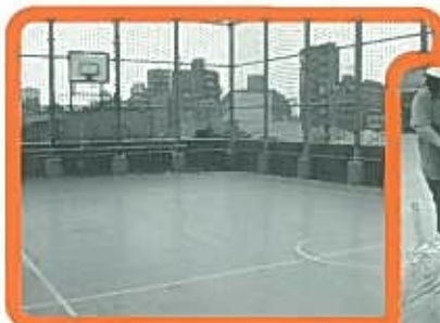
広い屋上 バスケットゴールがあります

また、屋上には中学生以上の利用者が、自由に利用できるバスケットゴールが設置されています。夏季にはビニールプールを設置し、乳幼児親子の楽しい水遊び空間にもなっています。