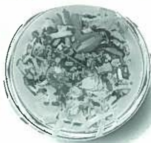
冷やしきつねうどん