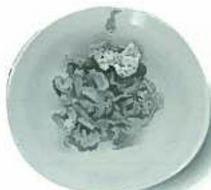
ゴーヤと豚肉のチャンプル