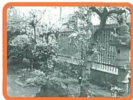
樹木いっぱいの庭

ロビーに、利用者の方が週ごとに盆栽をセッティングしてくださっています。岩の上に咲いた花、木々、小石が緑鮮やかで、猛暑でも涼風を呼んでくれています。