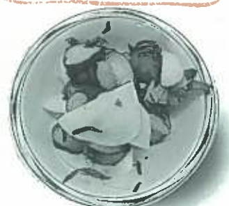
きゅうりとかぶの塩こんぶ漬け