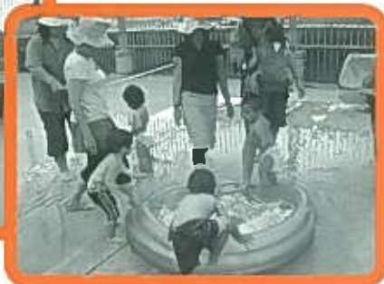
屋上での水遊びの様子