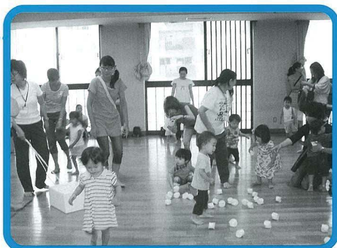
子育てひろば「運動会」