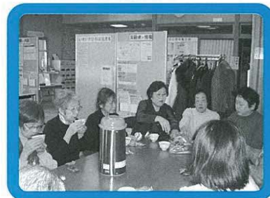
いきいきひろば 「サークル後のお茶タイム」