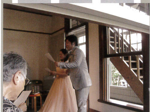
「小さい秋みつけた」合唱中の様子