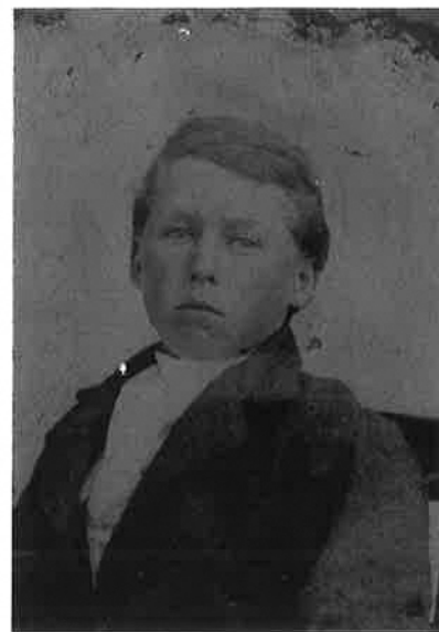
▲12歳ごろのマッケーレブ。 初めておさがりではない服を着て、 写真屋に撮ってもらいました。

今回は、野村氏が調査結果をまとめた『福音』や、昭和3(1928)年にマッケーレブと同宗派である「キリストの教会 (Church of Christ)」の日本人によって発行された機関誌『道しるべ』を参考に、マッケーレブの幼少期の姿を追います。