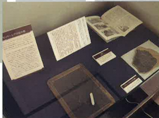
▲新規展示は当館の2階にあります。ぜひご覧ください。