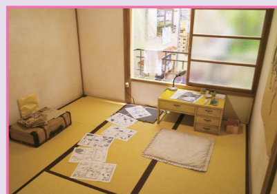
2 19號房 水野英子