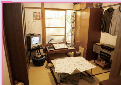
3 20號房 鈴木伸一 森安直哉 橫田德男