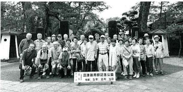
和気あいあい有意義な研修会でした

立秋翌日の8月9日(水)「新任理事、常任理事・女性委員研修会」が開催されました。沼津方面へ総勢32名、日帰りバスを