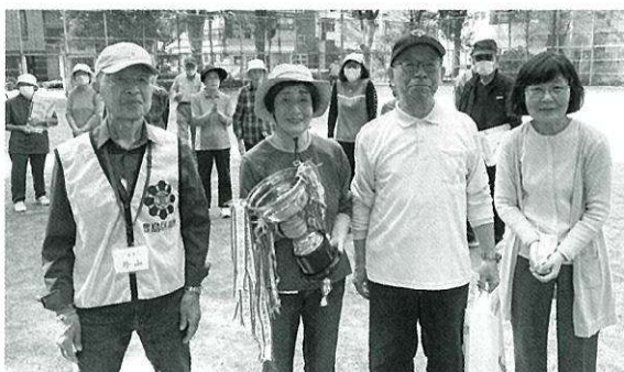
優勝 南長崎四丁目福寿会 Aチーム

10月19日(木) 西池袋公園にてペタンク大会が開催されました。抽選で組み合わせを決め、10チームがトーナメントで順位を競いました。結果は優勝 南長崎四丁目福寿会Aチーム、準優勝は折戸千歳会Aチーム、3位は折戸千歳会Bチームの皆さんでした。おめでとうございます。今回参加されなかった他地区の皆さんのご参加もお待ちしております。