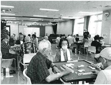
初開催にして大盛況

今回は将棋の参加者がなく、囲碁も4名と寂しい状況でしたが、麻雀は参加者32名、8卓を用意するほどの盛況となりました。