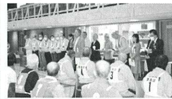
豊島区ルールの3m式で開催

10月16日 （月）豊島 体育館にて 4年ぶり、 秩父市老連 の皆さんと 「令和5年 度秩父市・ 豊島区姉妹都市親善交流輪投げ 大会」を開催しました。