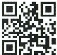
しにあナビとしま