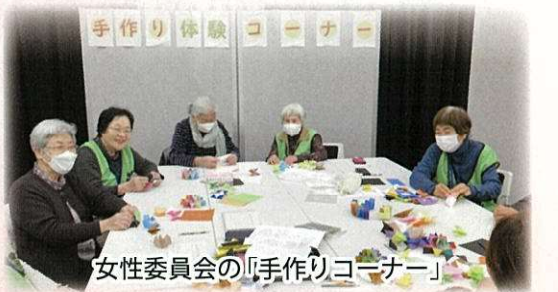
女性委員会の「手作りコーナー」