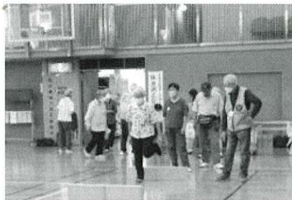
健康長寿めざして体力測定

※測定手帖を忘れた人には次 回からは「仮記録表」をお渡し してそれに記録、ご自宅で転記 していただくことにします。