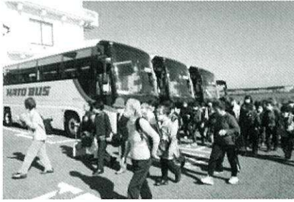
天候にも恵まれました

もと、房州は銚子電鉄レトロ電 車に乗った後、犬吠埼周辺の観 光とお買い物ツアーをのんびり と楽しむことができました。