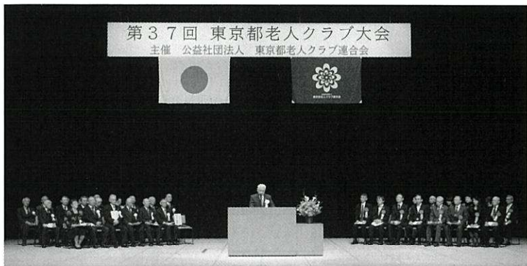
東京都老人クラブ連合会会長のあいさつ