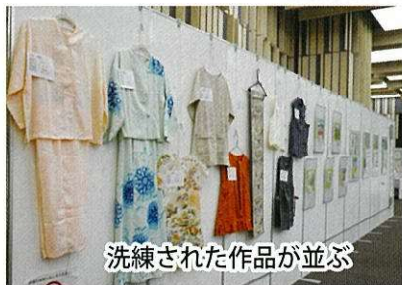
洗練された作品が並ぶ