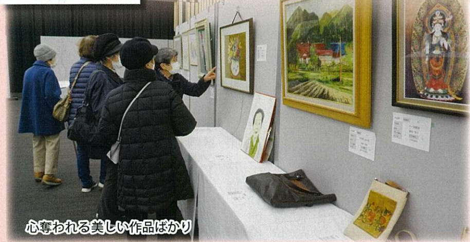
心奪われる美しい作品ばかり