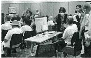
快適な医療を求めた体験会

大型モニター4台やPC、タブレットなど多数の機材を前に、16名の説明員による指導の下、メタバースや、バーチャルホスピタルの体験をすることができました。