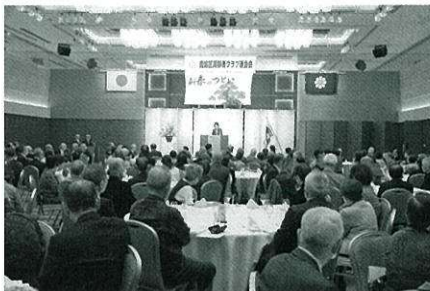
たくさんの参会者で賑わいました

本年も益々活発な連合会活動 で地域の各クラブを支援して参 ります。皆さまご協力ください。