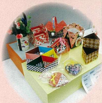
ぬくもりあふれる作品たち