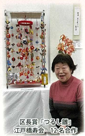
区長賞「つるし雛」 江戸橋寿会 12名合作