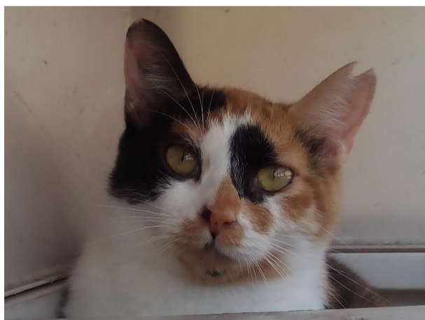
花梅(ハナウメ)ちゃんは2017年(推定) 生まれの元野良猫(三毛の女の子)、2018年7月に豊島区池袋で保護、 避妊手術済のさくら猫です。