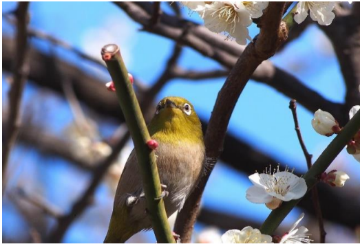
「都会の中で共生している自然と野生生物 庭園にある梅の木を訪れるメジロ」

都会の生活の中にも身近にたくさんの野生生物が生きています。 人間が飼育している動物だけが愛されるわけではなく野生に生きる動物たちや都会にある自然環境の保全を考えることも必要なことだと考えます。