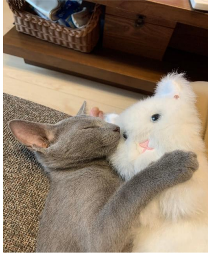
1歳4か月のロシアンブルー 名前は「美(メイ)」です。 お気に入りのぬいぐるみと一緒に寝ています。

都会の生活の中にも身近にたくさんの野生生物が生きています。 人間が飼育している動物だけが愛されるわけではなく野生に生きる動物たちや都会にある自然環境の保全を考えることも必要なことだと考えます。