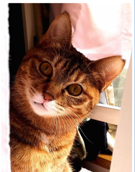
ルビー・スターちゃんは2020 年生まれの元野良猫(麦藁の 女の子)、1匹で迷子になって 居たので同年6月に豊島区池 袋で保護、避妊手術済のさくら 猫です。