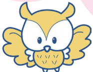
豊島区PRキャラクター「としまなまる」

アプリを起動したときに最初に表示される画面です。ここから様々な機能が繋がっています。