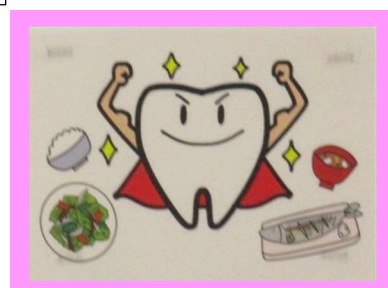
① 何でもよくかんで食べましょう！