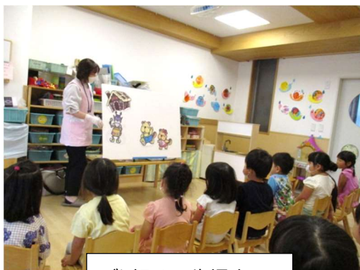
ばら組は4歳児室で

3.4.5 歳児クラス対象に、歯科衛生士さんによる歯みがき集会がありました。 「ビーバーのビッキーとハーちゃん」のパネルシアターをみながらお話を聞きました。