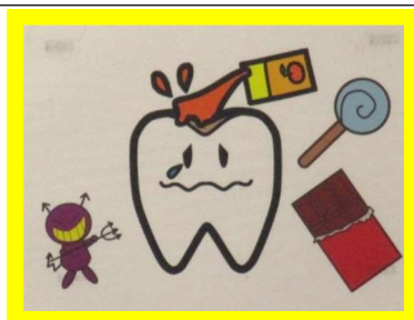
② 甘いものは少しにしましょう！