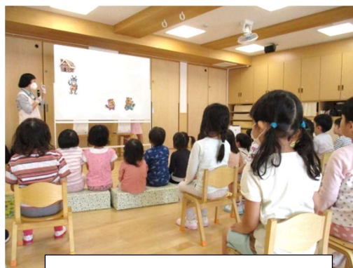
たんぼぼ組・ひまわり組はホールで