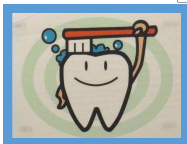
③ 食べたら歯をみがきましょう！