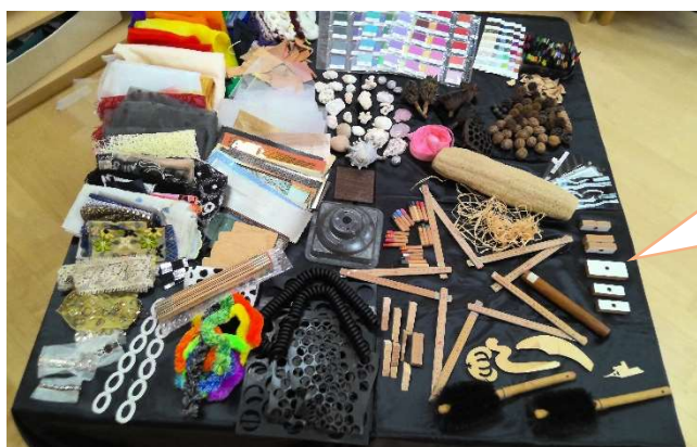
レミダ体験の様子

素材を並べるときに魅力的に見える並べ方をする事で多くの素材が使われるということで素材の並べ方にも工夫がありました！