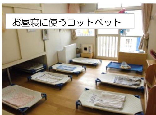
お昼寝に使うコットベット