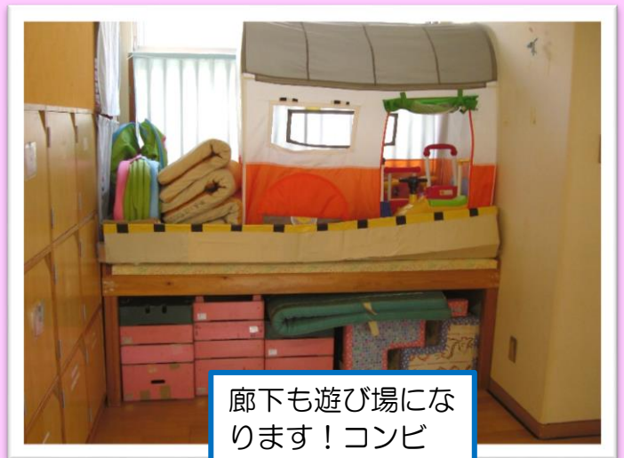
廊下も遊び場になります！コンビカーや、マット遊び、おうちごっこなど。