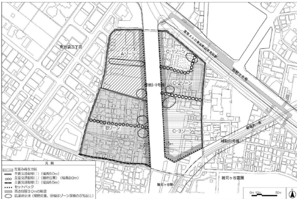
図表 2-1-19 南池袋二丁目地区街並み再生方針図