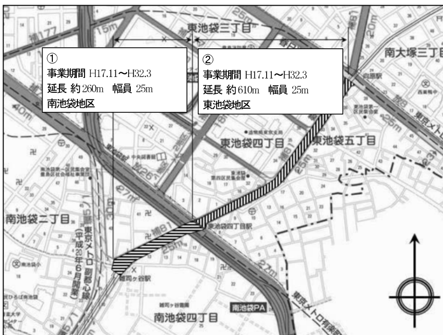
図表 2-2-21 補助 81 号線平面図