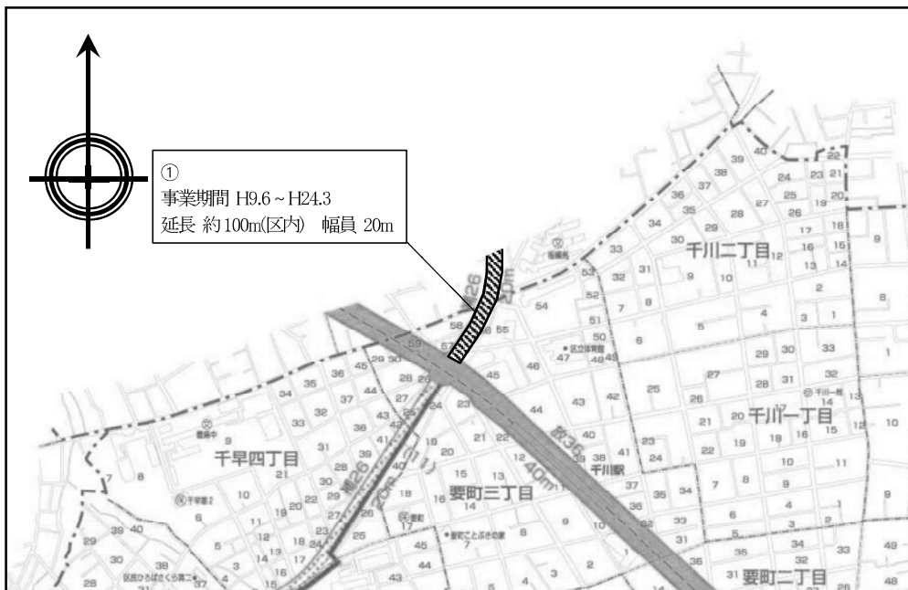
図表 2-2-17 補助 26 号線平面図