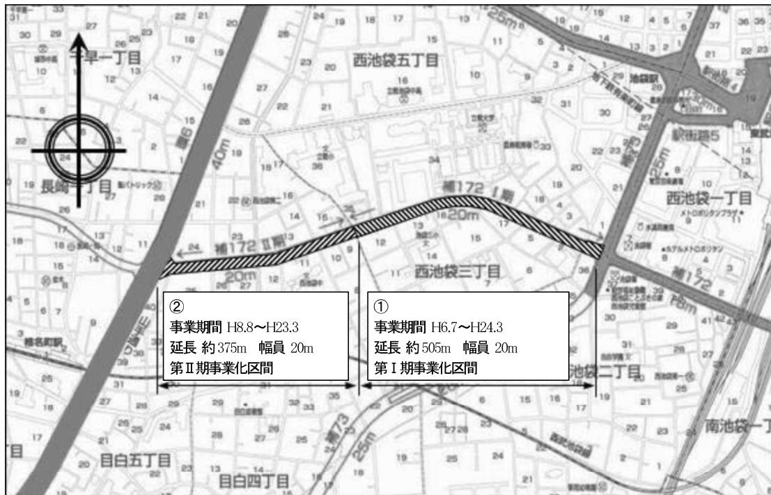
図表 2-2-25 補助 172 号線平面図