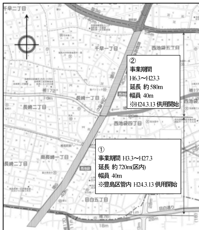
図表 2-2-15 環状6号線平面図