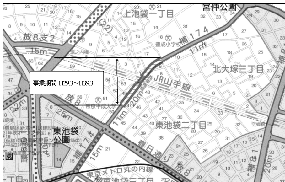
図表 2-2-29 補助 174 号線平面図