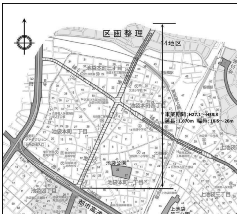
図表 2-2-19 補助 73 号線平面図