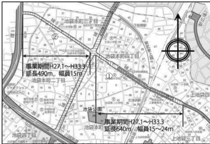
図表 2-2-23 補助 82 号線平面図