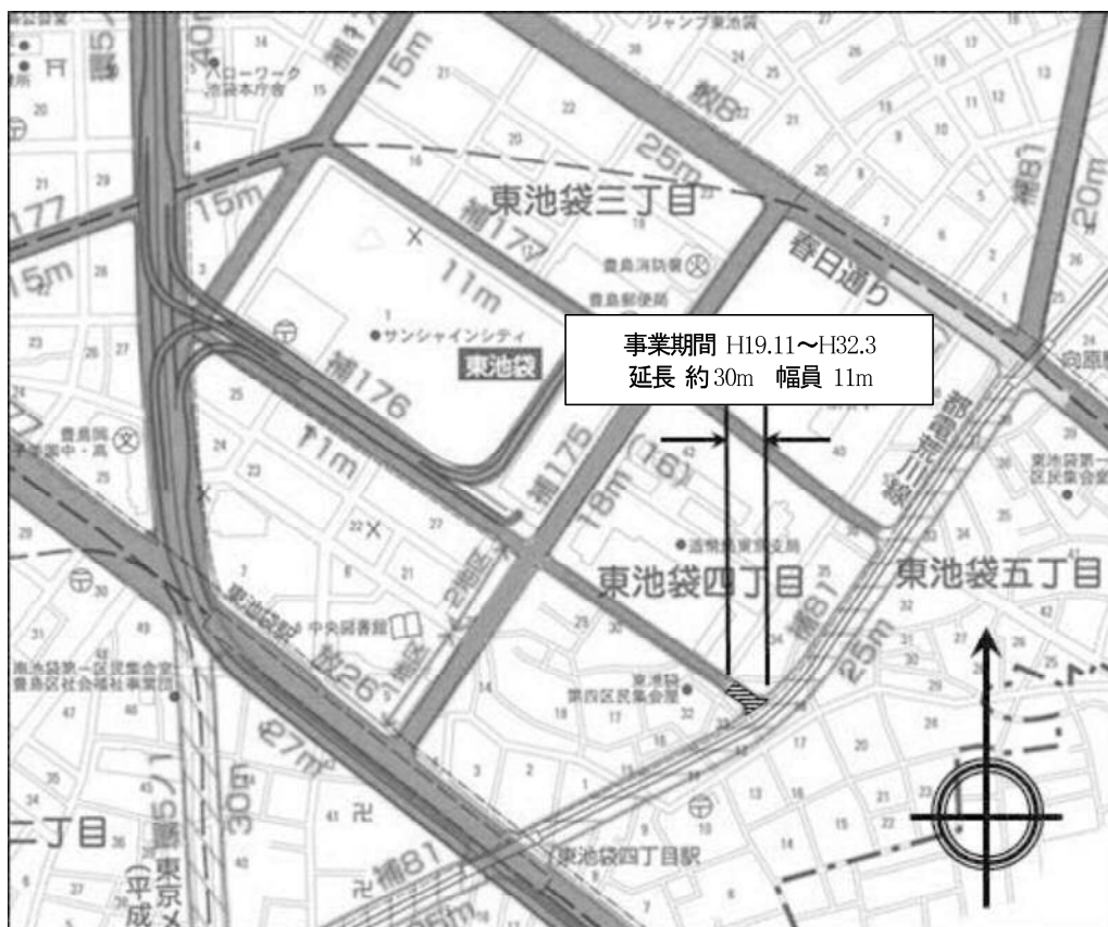
図表 2-2-33 補助176号線平面図