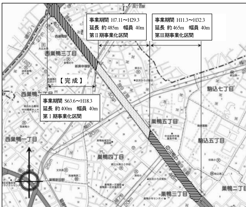
図表 2-2-9 放射9号線平面図