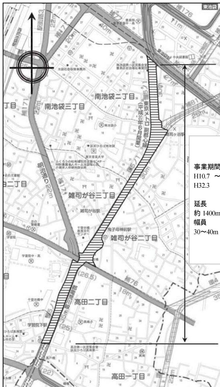
図表 2-2-13 環状5の1号線平面図(高田三丁目～南池袋二丁目)