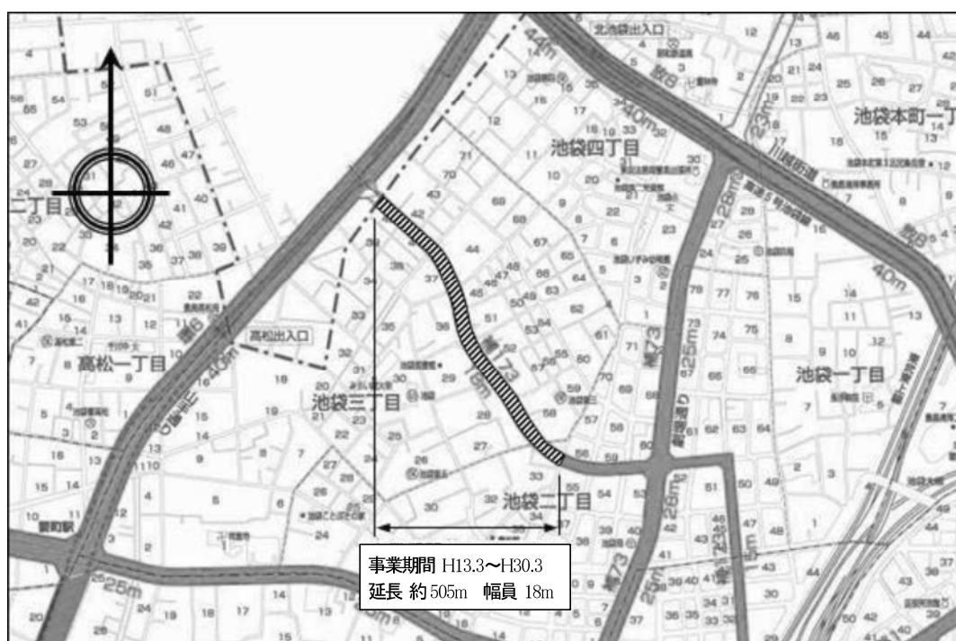
図表 2-2-27 補助 173 号線平面図