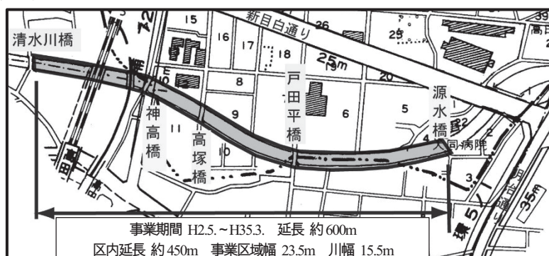
図表 2-3-42 神田川改修事業区間図

* 一級河川：河川法に基づいて、国土保全上及び国民経済上重要な水系として政令で指定された河川をいいます。