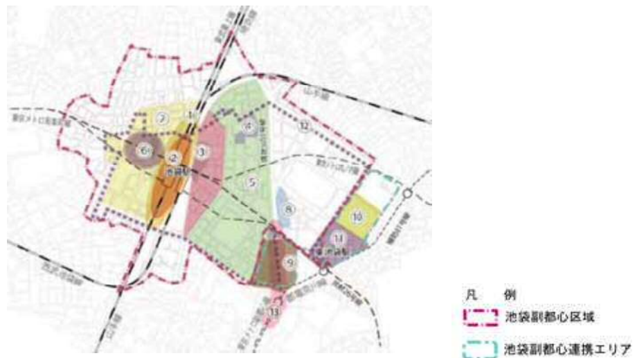
図表2-4-3 池袋副都心を再生へと導く都市整備プロジェクト