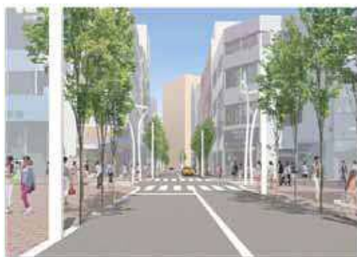
図表 2-5-10 南北区道の整備イメージ