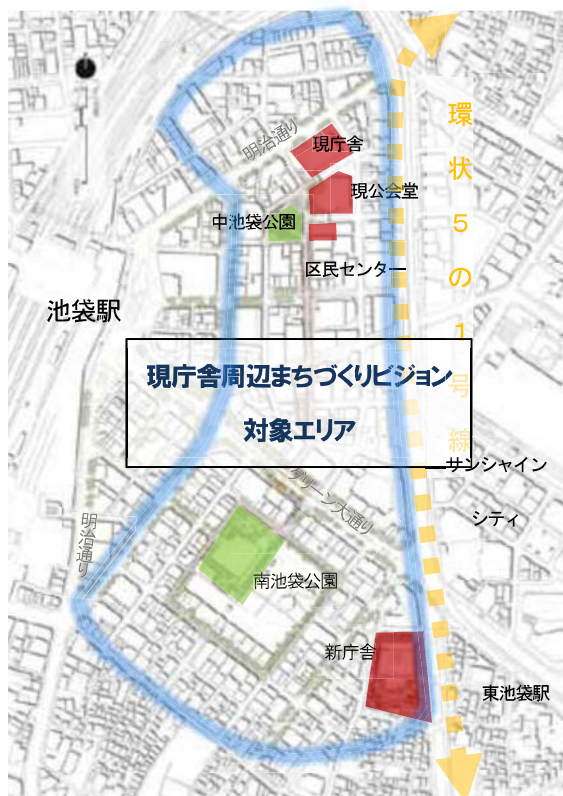
図表 2-5-9 現庁舎周辺まちづくりビジョン対象エリア