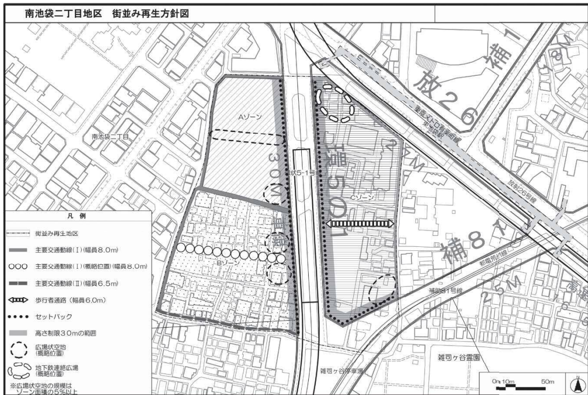
図表 2-1-20 南池袋二丁目地区街並み再生方針図