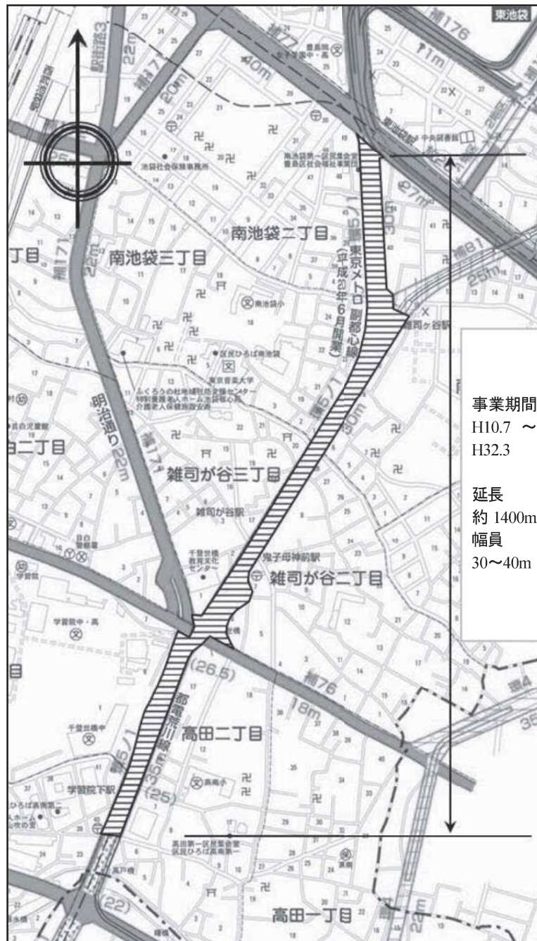
図表 2-2-13 環状5の1号線平面図(高田三丁目～南池袋二丁目)