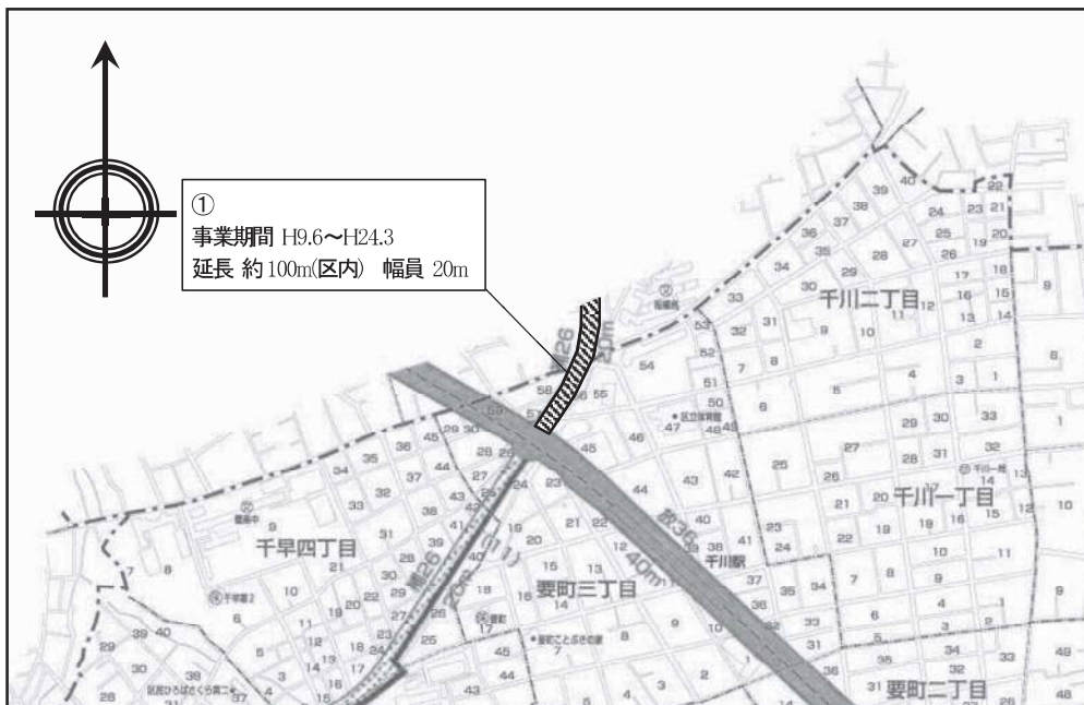
図表 2-2-17 補助 26 号線平面図