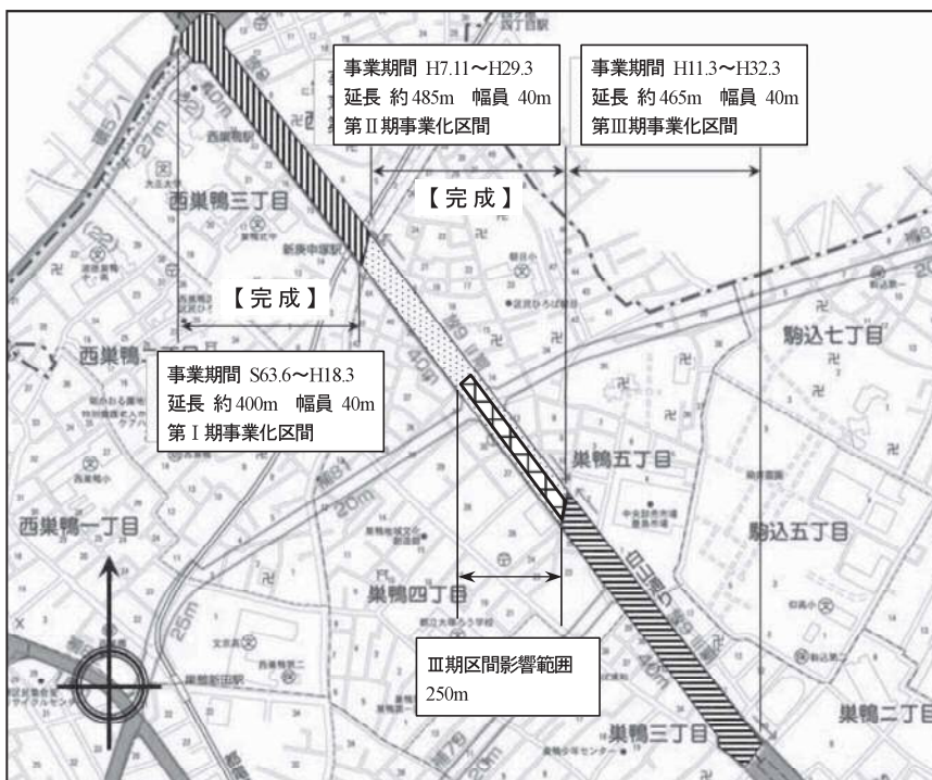
図表 2-2-9 放射9号線平面図