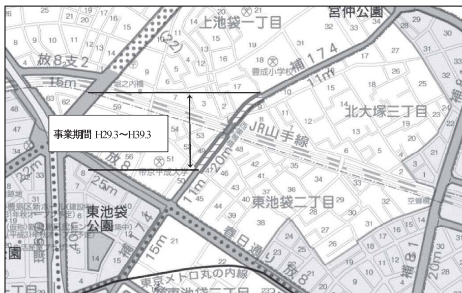
図表 2-2-29 補助 174 号線平面図