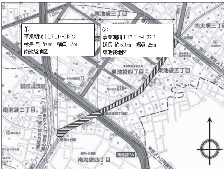
図表 2-2-21 補助 81 号線平面図