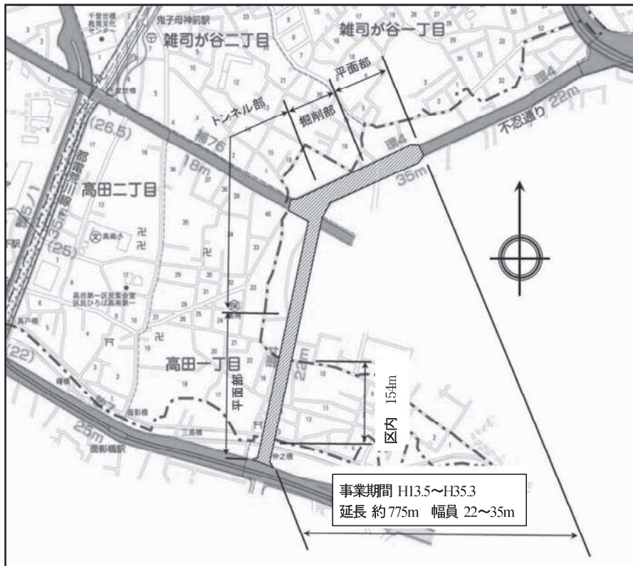
図表 2-2-11 環状4号線平面図