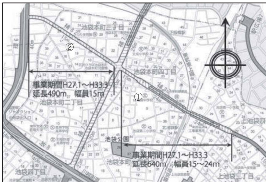
図表 2-2-23 補助 82 号線平面図