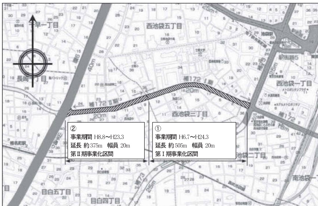
図表 2-2-25 補助 172 号線平面図