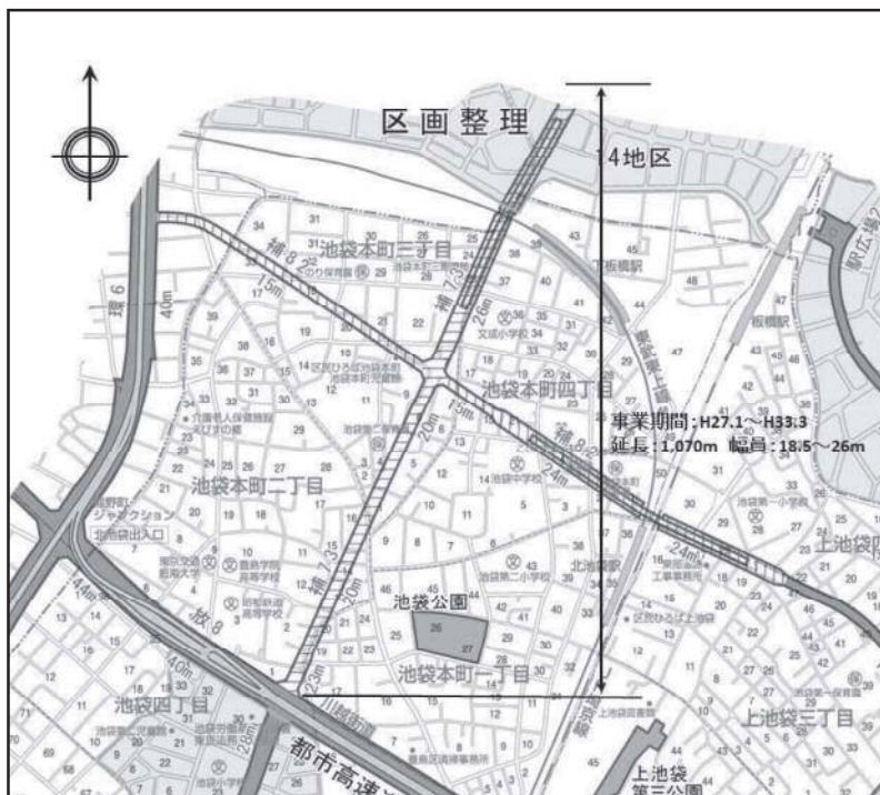
図表 2-2-19 補助73号線平面図