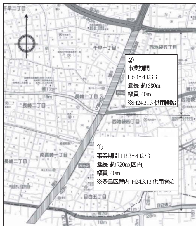
図表 2-2-15 環状6号線平面図