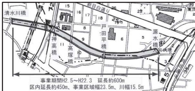
図表 2-3-49 神田川改修事業区間図