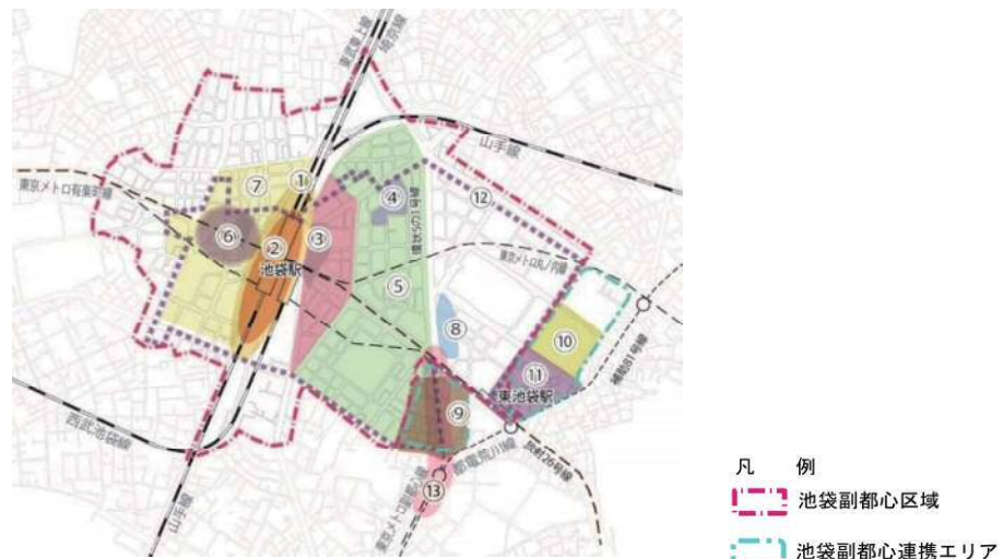
図表2-4-3 池袋副都心を再生へと導く都市整備プロジェクト