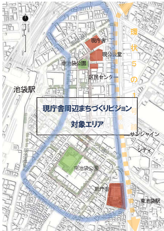
図表 2-5-10 現庁舎周辺まちづくりビジョン対象エリア