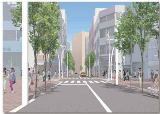
図表 2-5-11 南北区道の整備イメージ