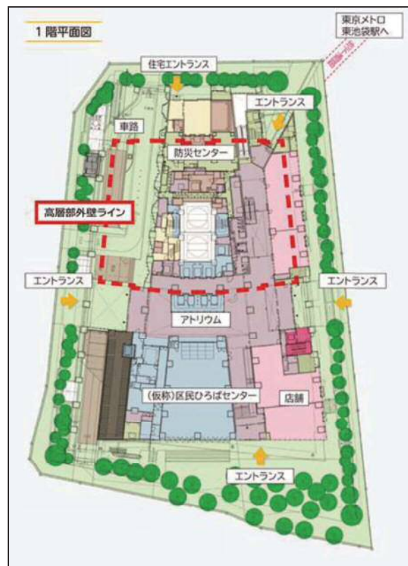
配置図(1階平面図含む)