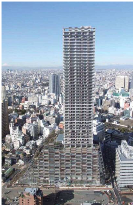
東側からの建物竣工写真