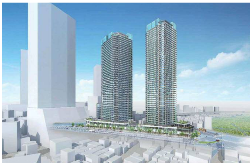
図表 2-1-18 西側からのイメージパース