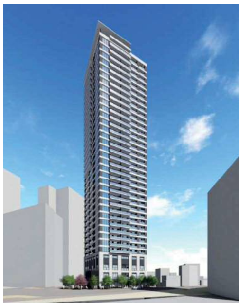
図表 2-1-17 日の出通り側からのイメージパース