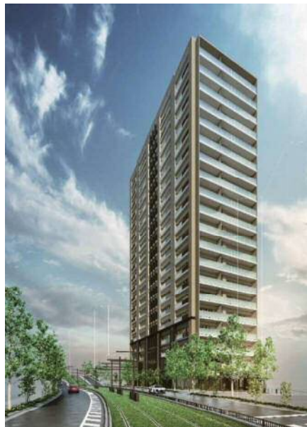
図表 2-1-16 補助81号線側からのイメージパース