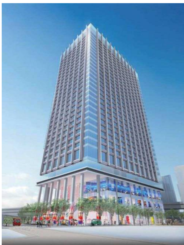
図表 2-1-19 南西側からのイメージパース