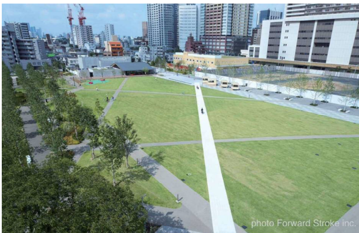
図表2-1-28 完成全景写真（としまみどりの防災公園・としまキッズパーク）

今後は、地区計画等に沿って、池袋副都心と木造住宅密集地域に隣接する立地特性に配慮した、防災に強く、文化と賑わいを創出する活力ある市街地の形成を目指します。