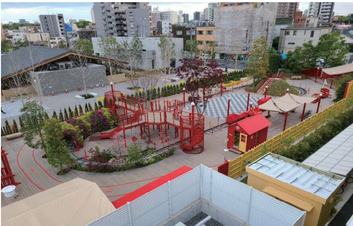
図表2-1-29 完成全景写真（としまキッズパーク）

としまキッズパークの目標は、◇いろいろな子どもたちが一緒に遊べる公園◇子どもたちの個性を理解し尊重しあう場◇子どもたちが自分で遊びを見つけだす公園としています。