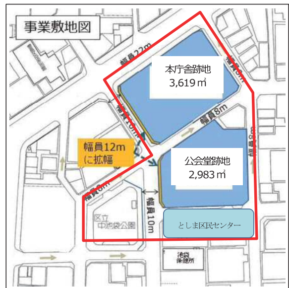
図表 2-1-32 事業敷地図