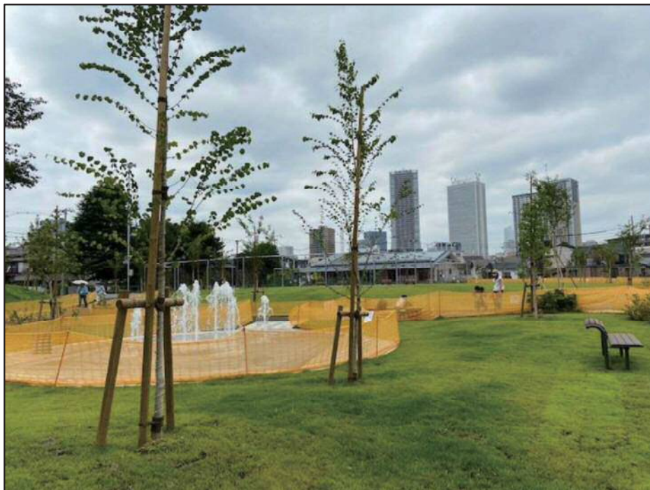
図表 2-1-30 完成写真

公園整備に関しては、平成29年12月より、既存校舎の解体工事に着手し、平成30年9月に解体工事を完了。令和2年3月には新しい雑司ヶ谷公園として全面開園しました。