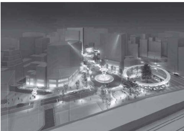
図表 2-5-4 北口駅前広場