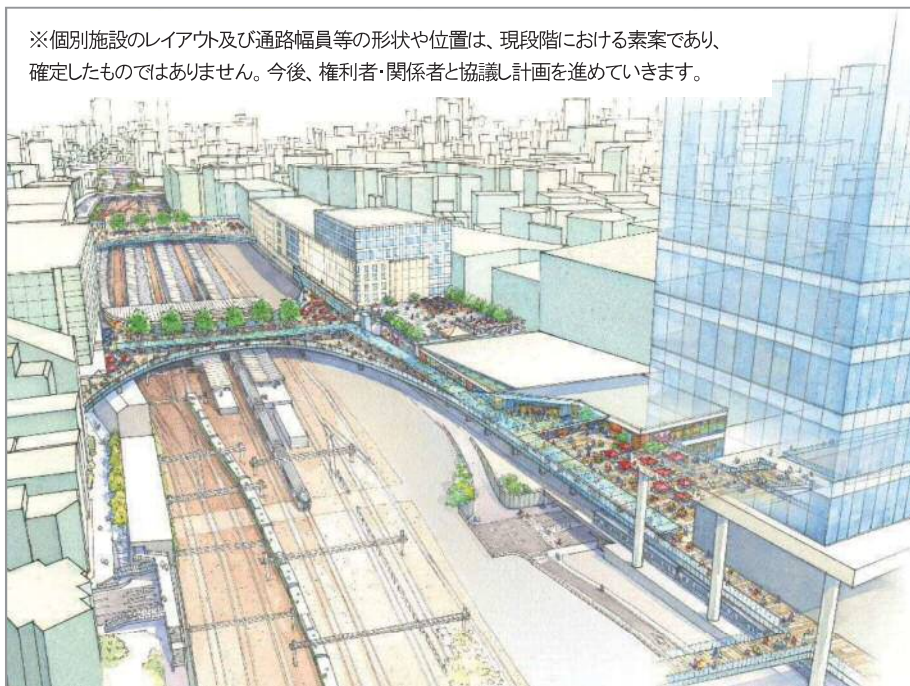
図表 2-5-7 東西デッキ整備のイメージ