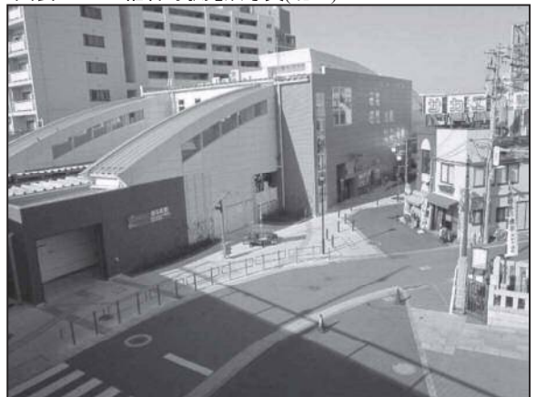
図表 2-5-6 椎名町駅完成写真(北口)