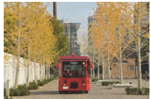
図表 2-2-42 IKE・SUNPARK を走る IKEBUS