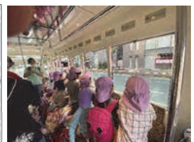
図表 2-2-44 区内の保育園・幼稚園児童の体験ツアー