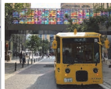
図表 2-2-45 Hareza 池袋停留所