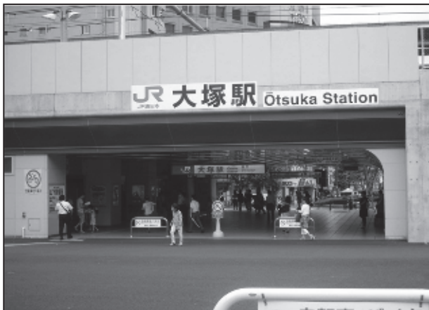
図表 2-5-4 北口駅前広場