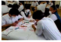
HUG(避難所運営ゲーム)の実践(3年生)

駒込中学校では、災害発生時に中学生が支援現場の中心的な役割を担っていくため、SDGs防災授業を行っています。地域や行政と連携し、共に地域を守り、住み続けられるより良いまちづくりを目指していきます。