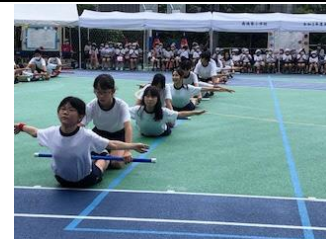
(棒を使い、接触をなくした表現運動)